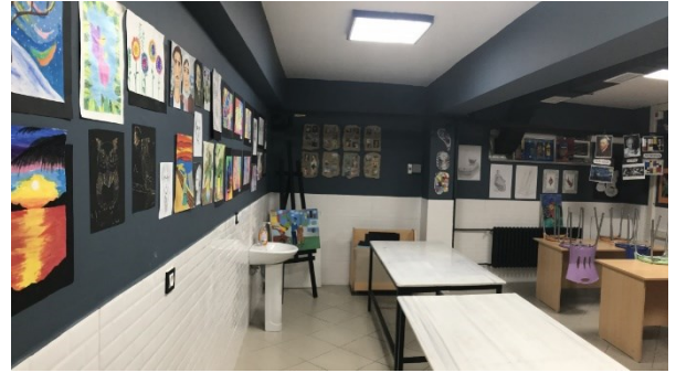
Görsel Sanatlar Atölyemiz