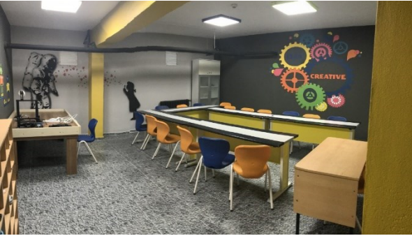
Yazılım ve Tasarım Atölyemiz