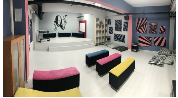
Drama ve Eleştirel Düşünce Atölyemiz