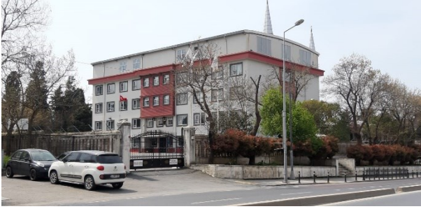
Okul Bahçe Girişimiz